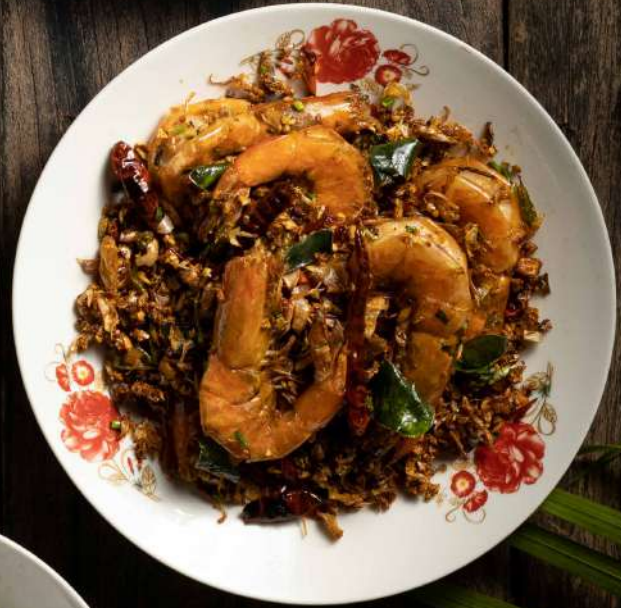
35. กุ้งคั่วพริกเกลือ Stir fried prawns with garlic and chili 350.-