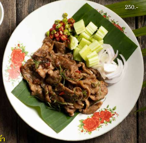
34. หมูผัดกะปิ Stir fried pork with shrimp paste 250.-