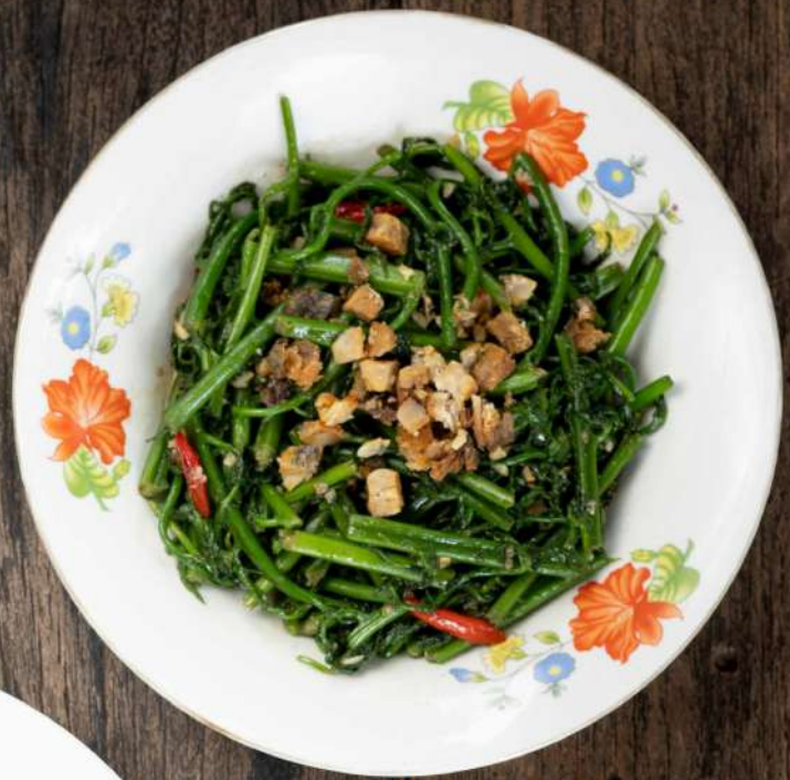
33. ผัดผักกูดปลาเค็ม Stir fried paco fern with Thai anchovy 260.-