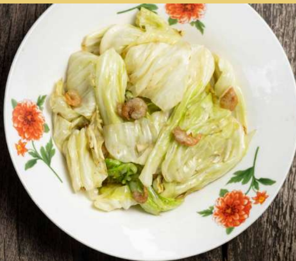
50. กะหล่ำปลีผัดน้ำปลากุ้งแห้ง Stir fried cabbage with fish sauce and dried shrimps 220.-