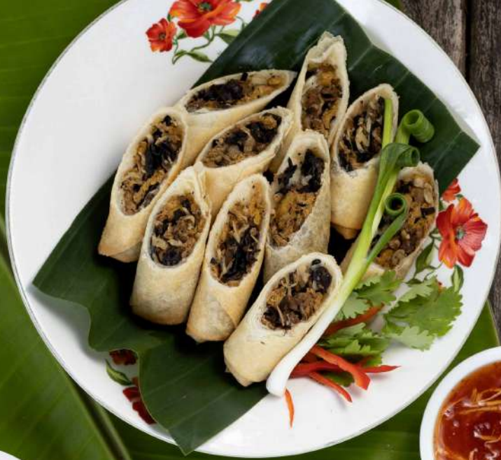
1. ปอเปี๊ยะพลอยสี Deep fried "Ploy Sea" spring rolls 200.-