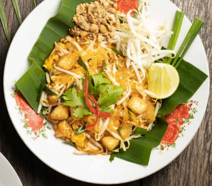
93. ผัดไท Pad Thai 200.-