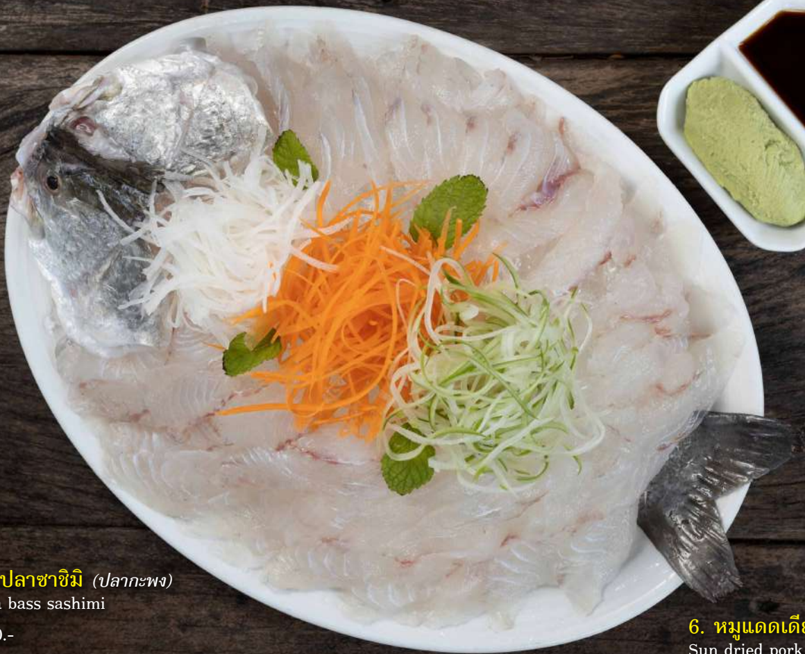
4. ปลาซาซิมิ (ปลากะพง) Sea bass sashimi 900.-