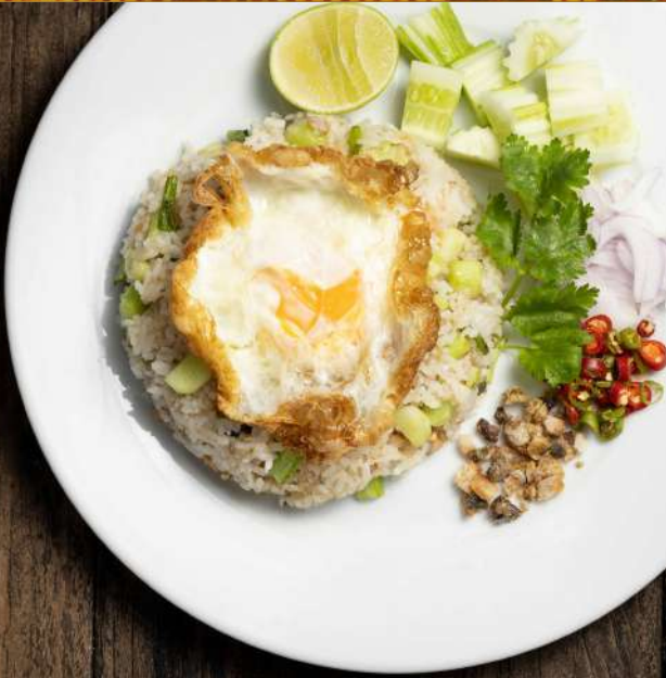
71. ข้าวผัดปลาเค็ม Fried rice with salted fish 200.-