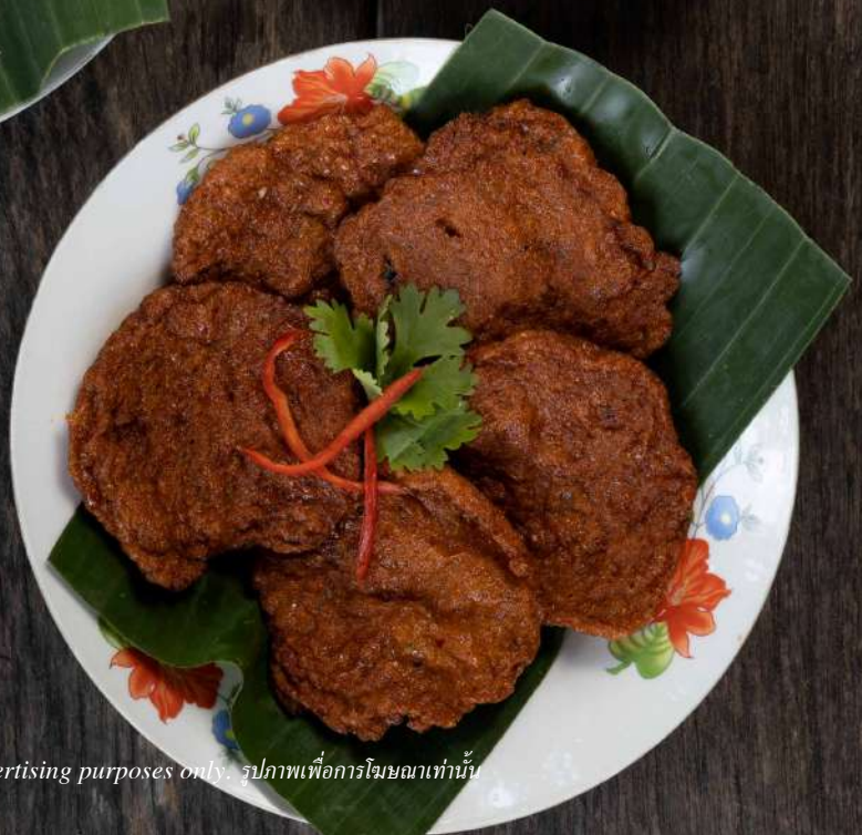
3. ทอดมันปลาอินทรี Deep fried mackerel fish cake 200.-