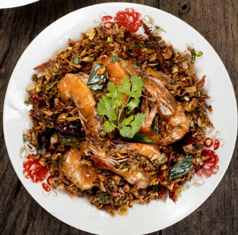
35. กุ้งคั่วพริกเกลือ Stir fried prawns with garlic and chili 350.-