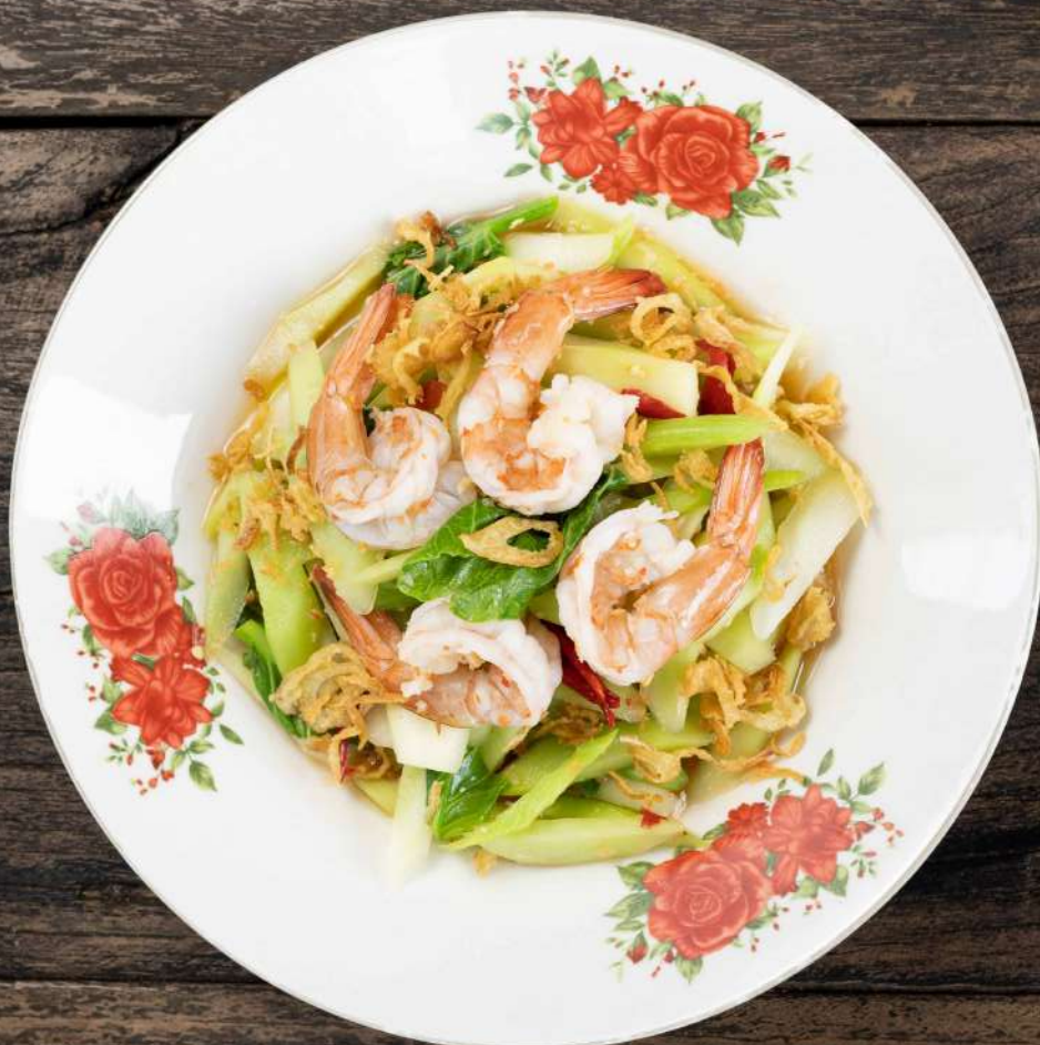
13. ยำคะน้ากุ้งสด Kale salad with prawns and herbs 290.-