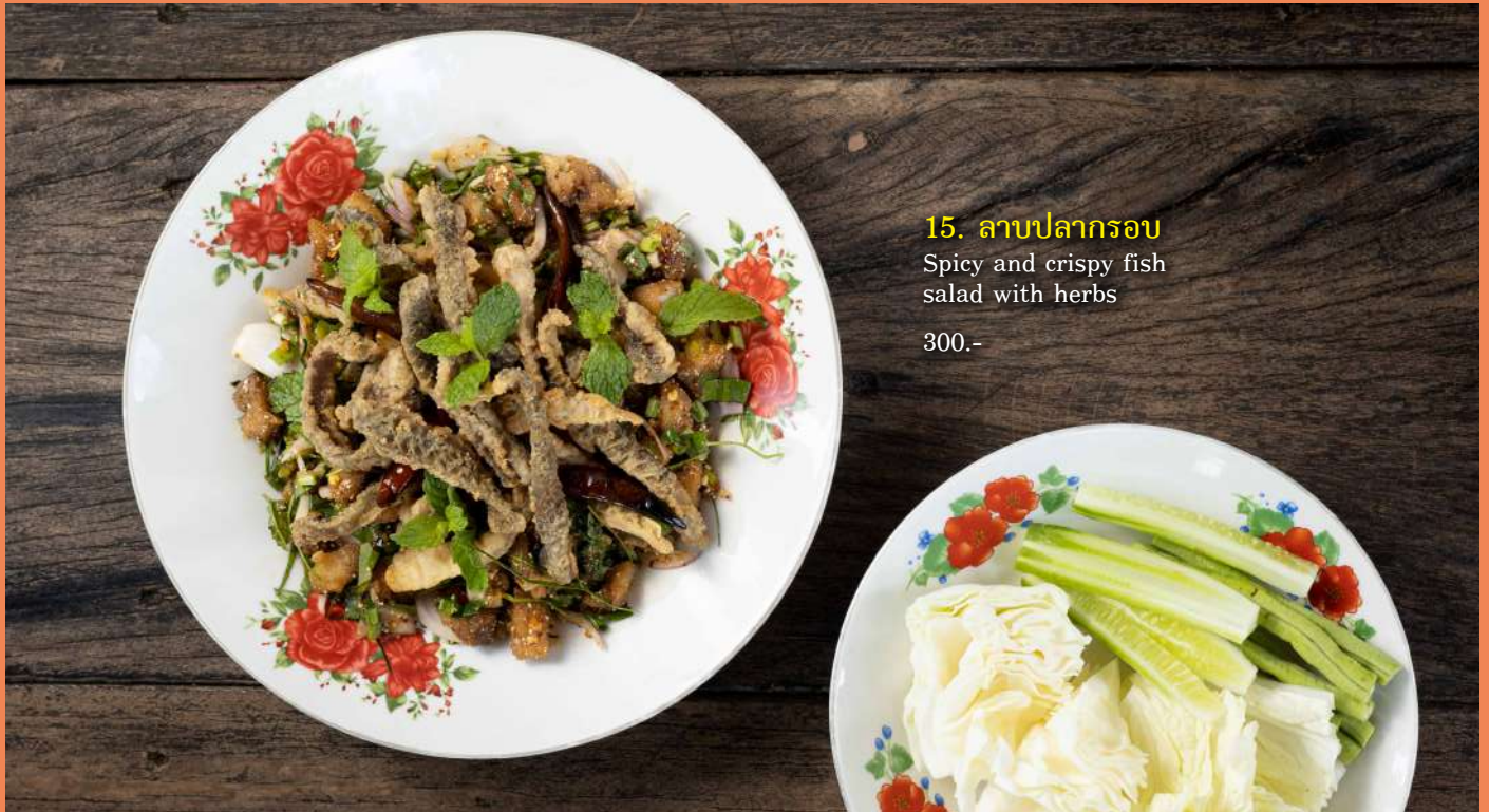
15. ลาบปลากรอบ Spicy and crispy fish salad with herbs 300.-

16. ยำวุ้นเส้นทะเล Glass noodle salad with seafood, chili and herbs