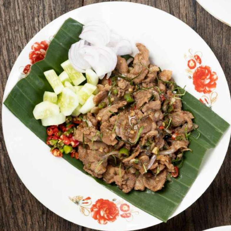
34. หมูผัดกะปิ Stir fried pork with shrimp paste 250.-