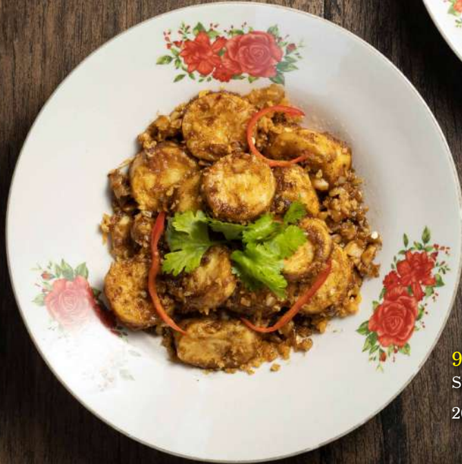
94. เต้าหู้ไข่ทอดกระเทียม Stir fried egg tofu with garlic 200.-

95. ปอเปี๊ยะผัก Fried vegetable spring rolls