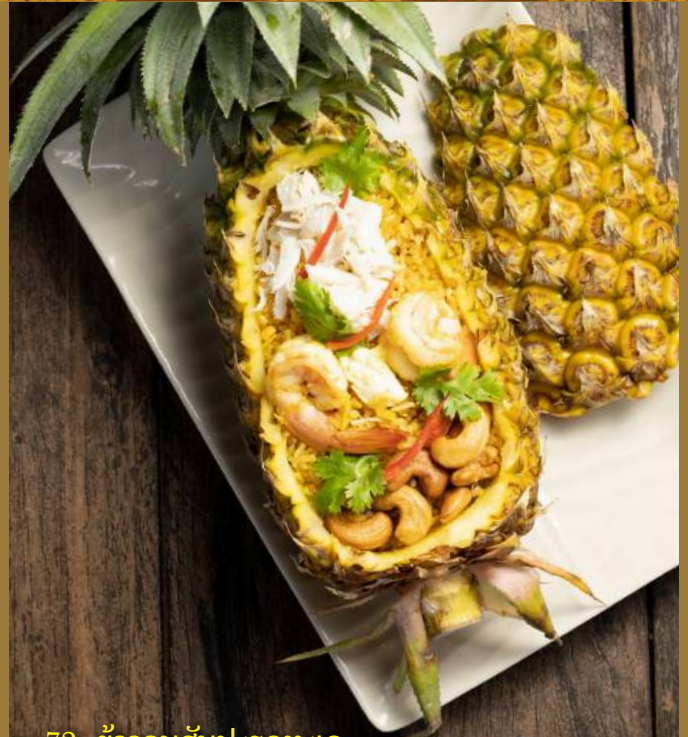
72. ข้าวอบสับปะรดทะเล Fried rice in pineapple with seafood 400.-