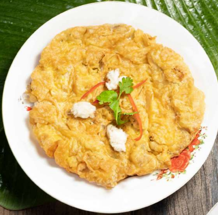
52. ไข่เจียวกุ้ง หรือ ปู Omelet stuffed with prawns or crab meat 250.- / 300.-