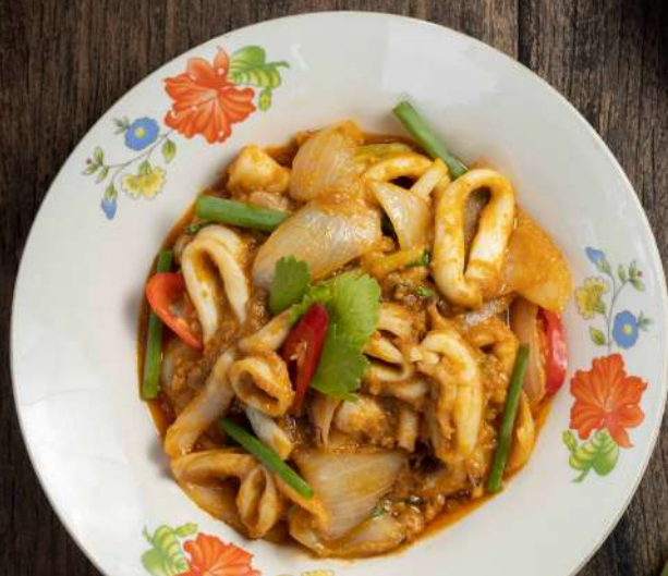
51. ปลาหมึกผัดไข่เค็ม Stir fried squid with salted egg 350.-