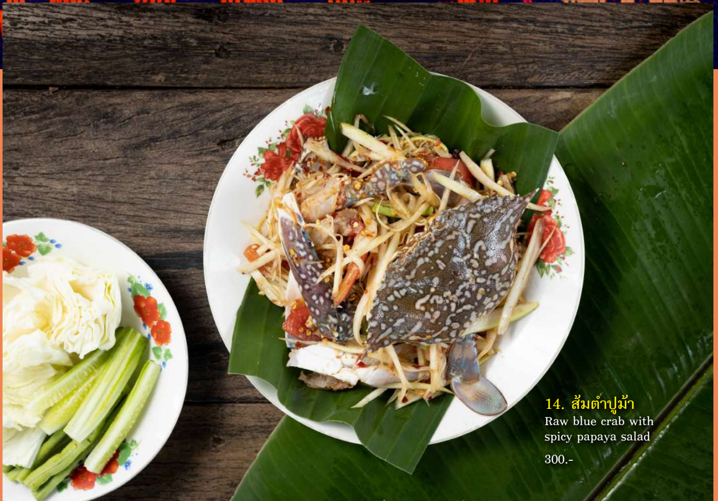
14. ส้มตำปูม้า Raw blue crab with spicy papaya salad 300.-