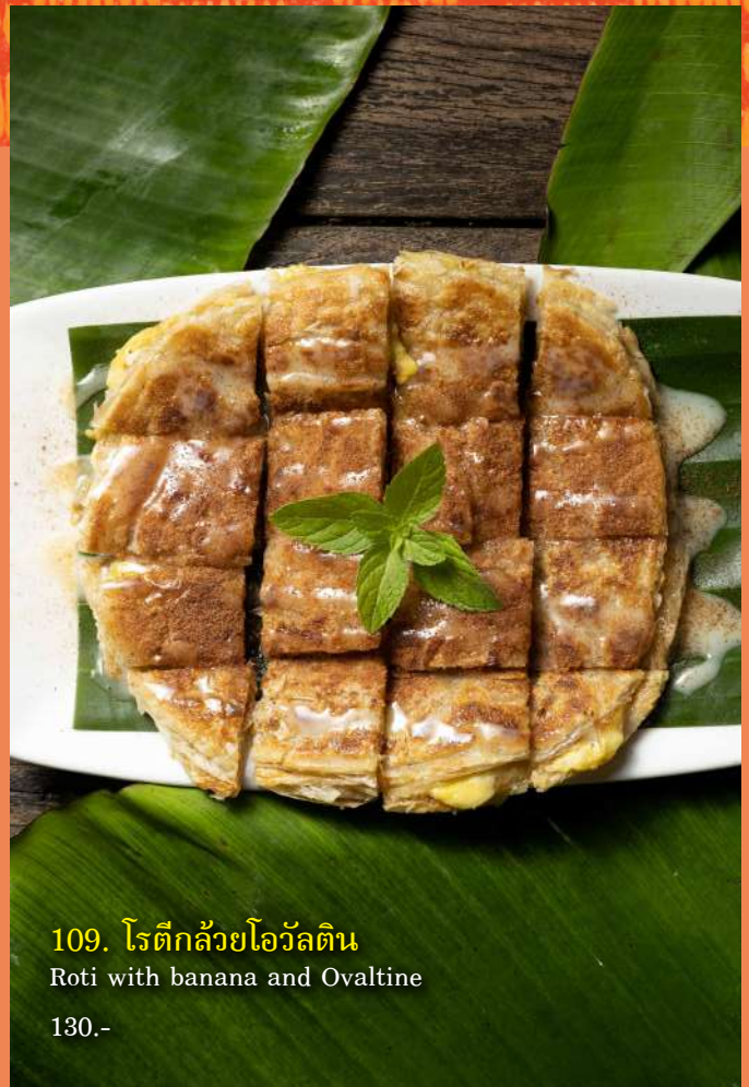
109. โรตีกกล้วยโอวัลติน Roti with banana and Ovaltine 130.-