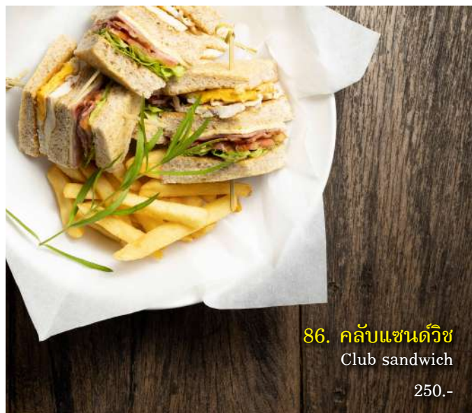
86. คลับแซนด์วิช Club sandwich 250.-