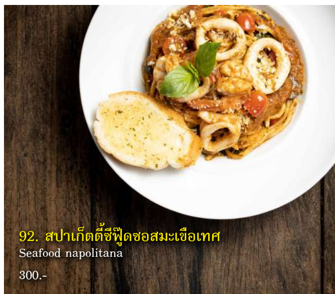
92. สปาเก็ตตี้ซีฟู้ดซอสมะเขือเทศ Seafood napolitana 300.-