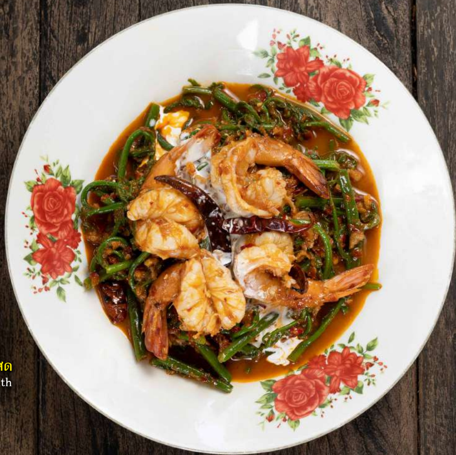
12. ยำผักกูดกุ้งสด Paco fern salad with prawns and herbs 290.-