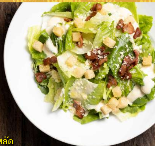
82. ซีซาร์สลัด Caesar salad 250.-