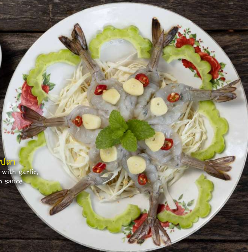
5. กุ้งแช่น้ำปลา Raw prawns with garlic, chili and fish sauce 300.-