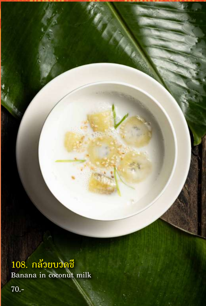
108. กล้วยบวดซี่ Banana in coconut milk 70.-