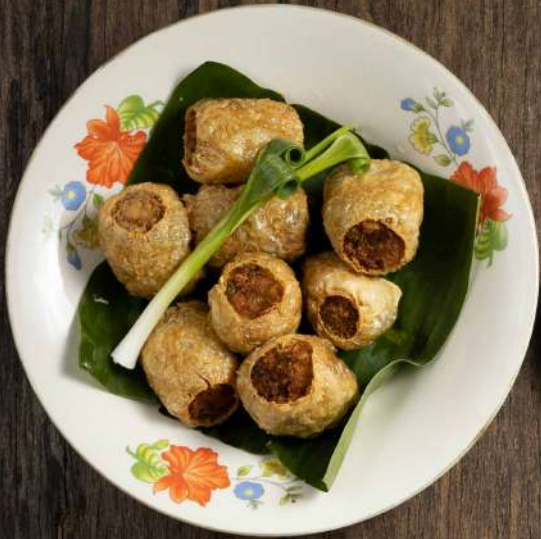
2. หอยจ๊อปู Deep fried crab meat roll 5 pcs. 350.- 8 pcs. 530.-