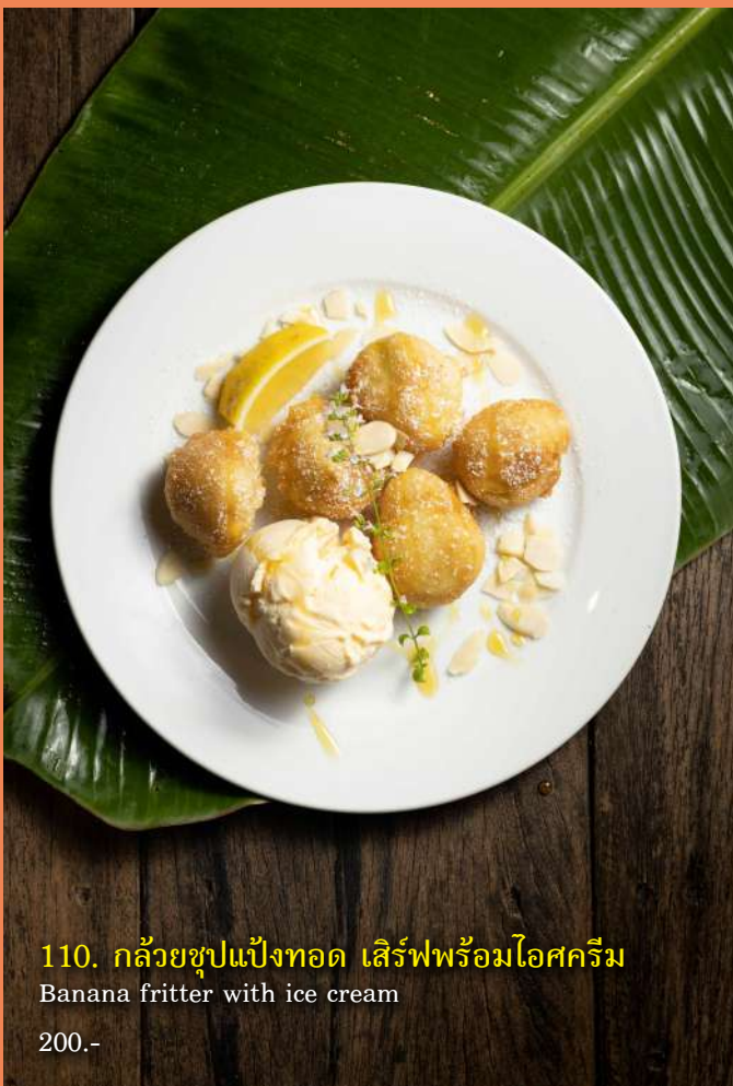
110. กล้วยชุบแป้งทอด เสิร์ฟพร้อมไอศกรีม Banana fritter with ice cream 200.-