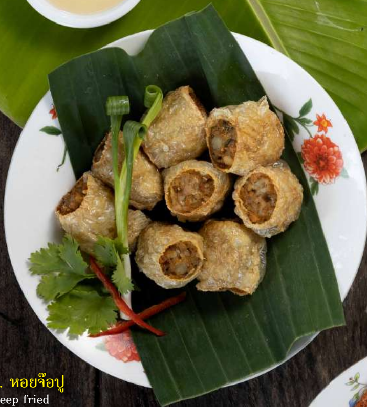
2. หอยจ๊อปู Deep fried crab meat roll 5 pcs. 350.- 8 pcs. 530.-