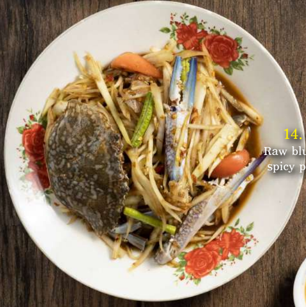
14. ส้มตำปูม้า Raw blue crab with spicy papaya salad 300.-